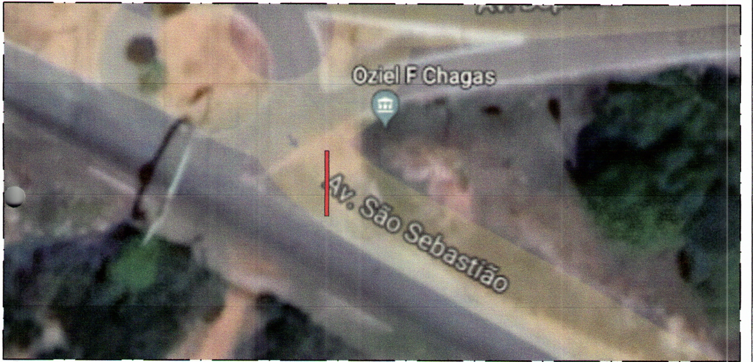
IMAGEM DO LOCAL