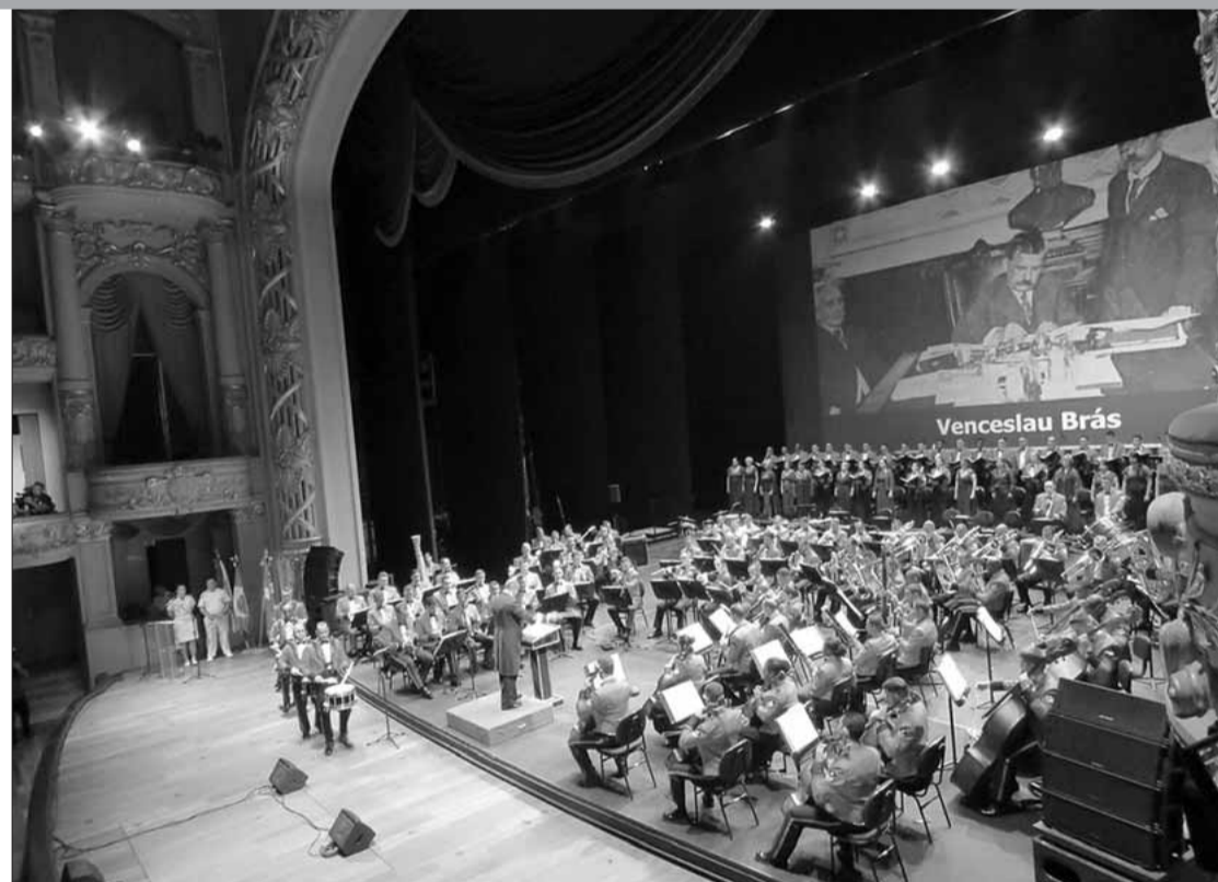
As apresentações das bandas unem músicas populares, eruditas e tradicionais da Marinha

po de fuzileiros navais para percorrerem o território nacional em concertos. A atividade tem como atrações a Banda Sinfônica Pelotão de Ordem Unida Silencioso, Banda Sinfônica e Banda Marcial. O acesso é gratuito e aberto ao público geral.