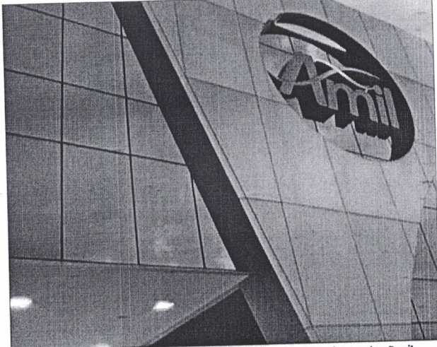
Operadora de plano de saúde conta com mais de 337 mil planos individuais em todo o Brasil

A Agência Nacional de Saúde Suplementar (ANS) determinou, de forma definitiva, que a Amil reassuma a carteira de 337 mil planos individuais transferida para a operadora APS no fim do ano passado.