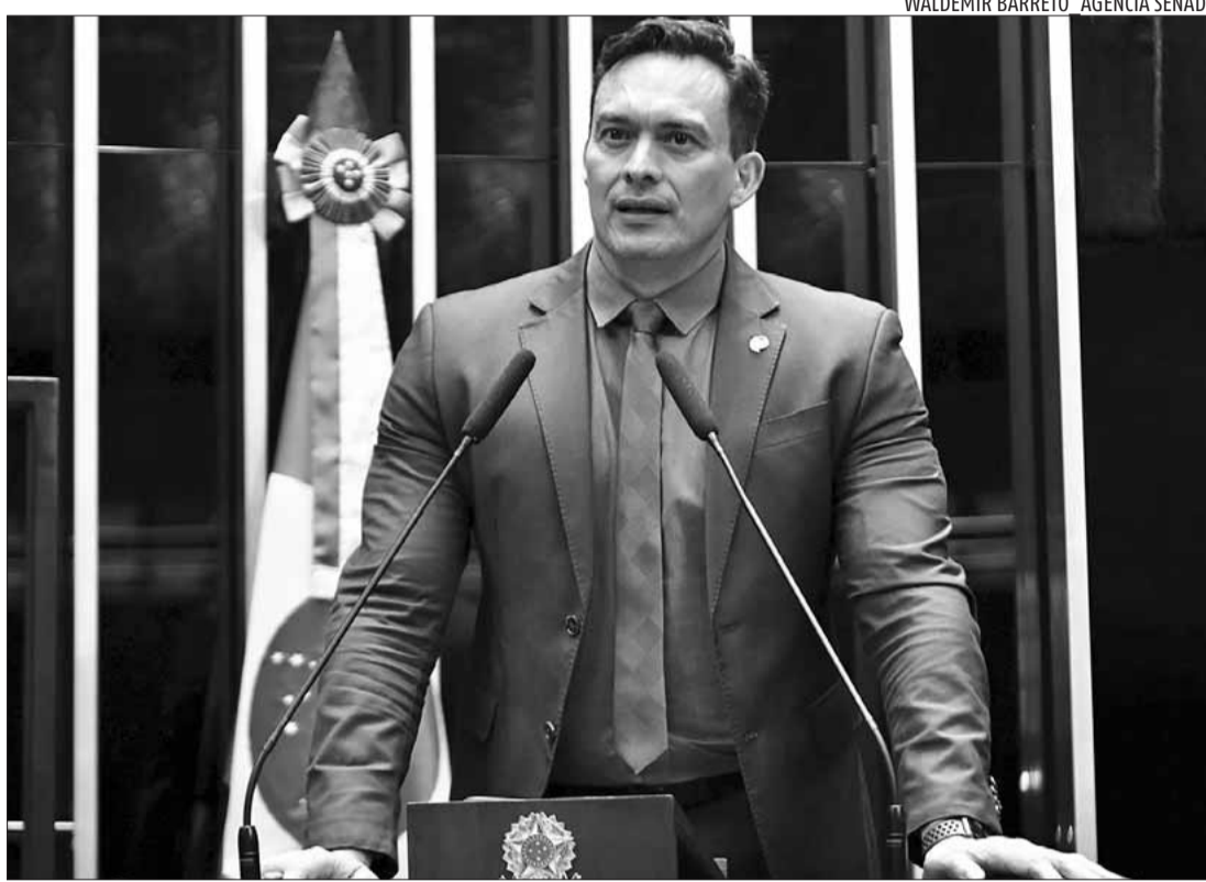
Senador Styvenson Valentim (Podemos-RN), aprovou no Senado projeto de lei no dia 23 de agosto

Valentim explica que será obrigatório o exame para renovação periódica do certificado do registro de arma de fogo. Pela proposta, o dono da arma deverá atualizar o exame toxicológico